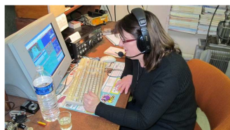
26-27 février, CdF téléphonie à F6KLO