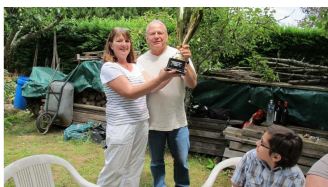
19 juin, remise de la coupe du REF2010 lors du barbecue à Varet