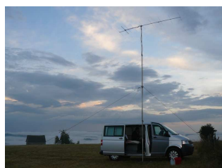
4-5 juin, CdF THF à Saint Robert