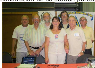
11 septembre, forum des associations à Brive