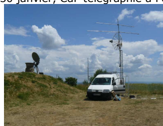
4-5 juin, CdF THF à Ayen