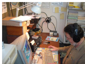
29-30 janvier, CdF télégraphie à F6KLO