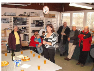
8 janvier, galette des rois à F6KLO